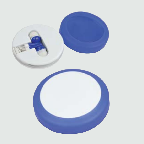
TEC 02 Earbuds Kepler