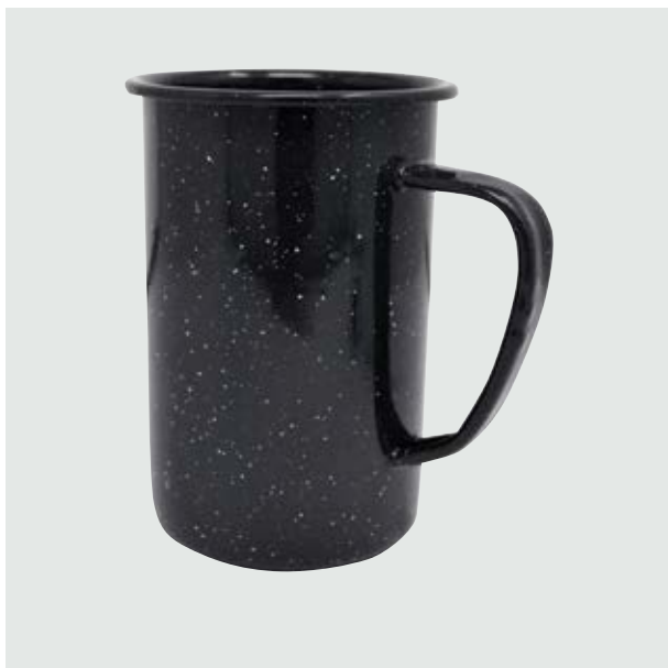
TH 213 Tarro Cervecero