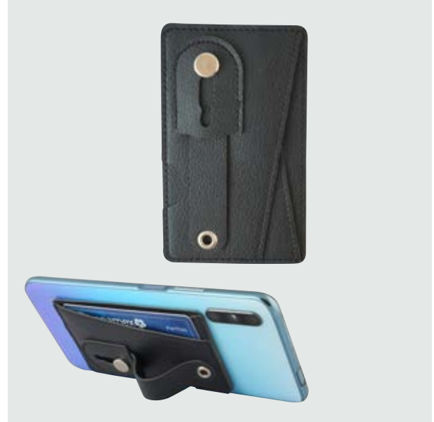
TEC 244 Tarjetero Hook

Material: Plástico y Silicón Medida: 6.2 cm diámetro